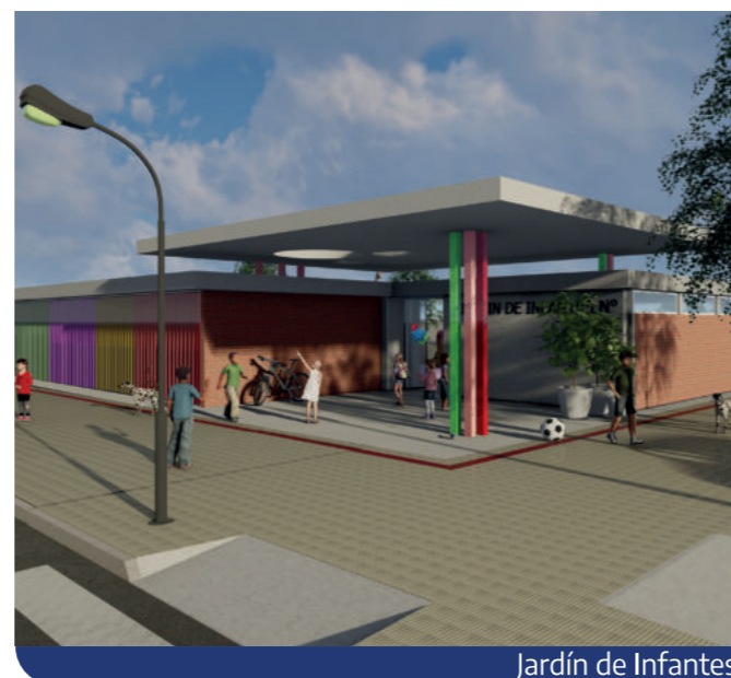
Jardín de Infantes