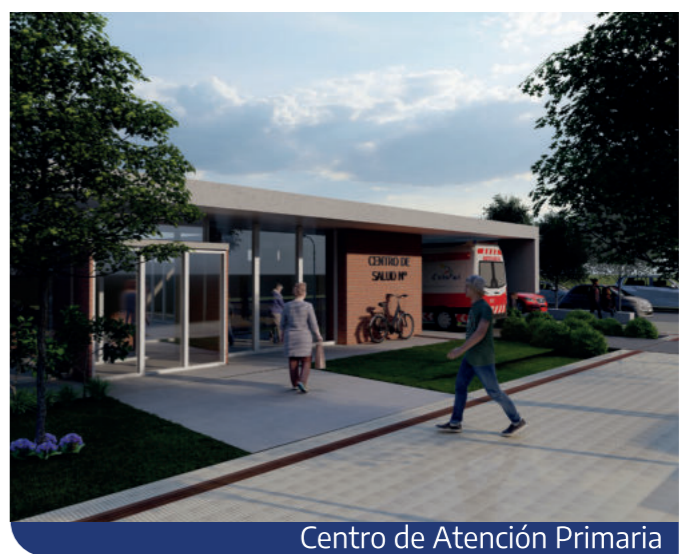
Centro de Atención Primaria