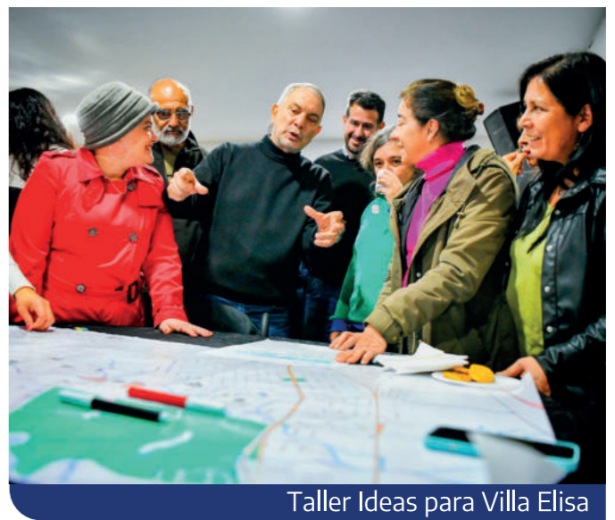
Taller Ideas para Villa Elisa