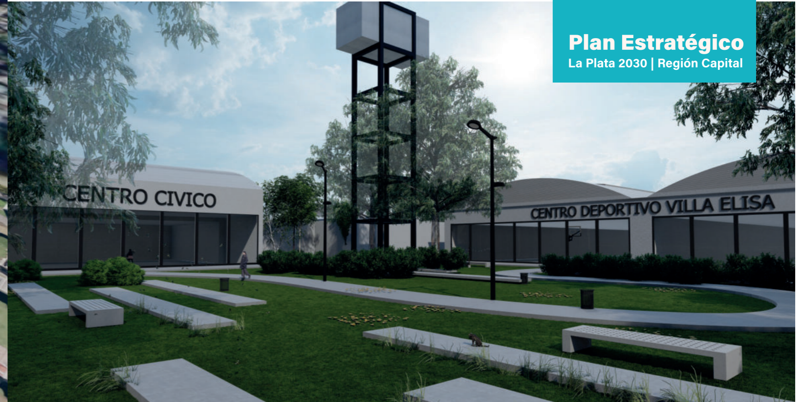
CENTRO CÍVICO ADMINISTRATIVO EN LOS TALLERES DE LA EX OFA