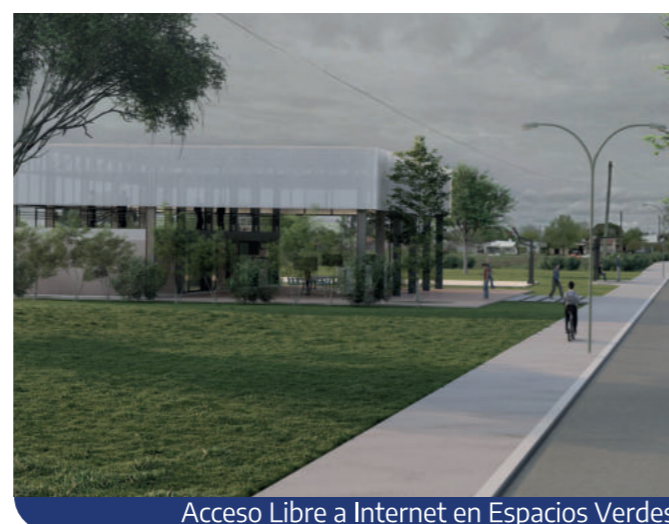
Acceso Libre a Internet en Espacios Verdes