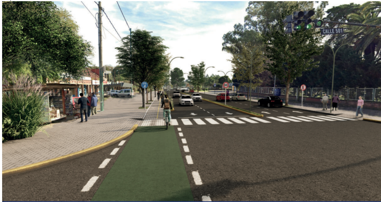
NUEVO CAMINO GENERAL BELGRANO