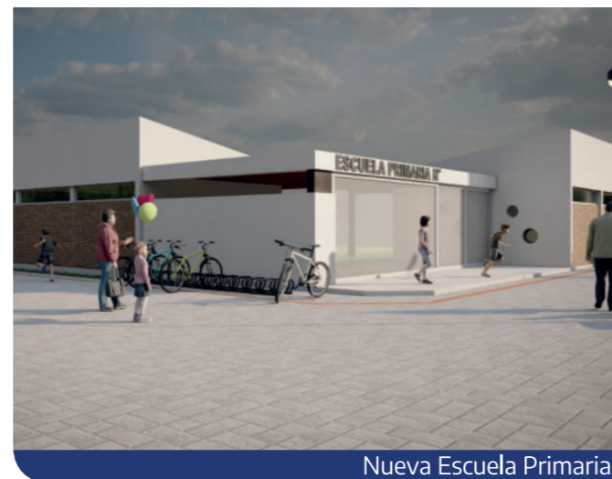
Nueva Escuela Primaria