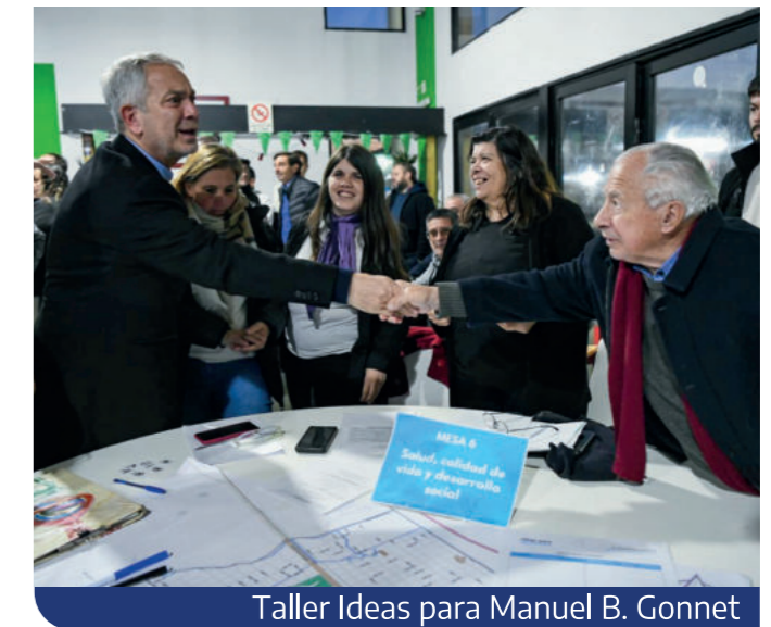
Taller Ideas para Manuel B. Gonnet

Ya a comienzos de la década del '30 se produjo el cambio de nombre de la estación por Manuel B. Gonnet y le dio al barrio su nombre definitivo, comprendiendo tanto a Villa Máximo Paz como a Villa Castells, a los que se sumaron nuevos barrios a medida que crecía la población y se extendía territorialmente.