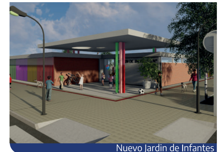
Nuevo Jardín de Infantes