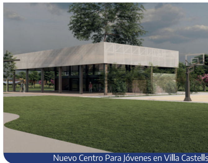
Nuevo Centro Para Jóvenes en Villa Castells